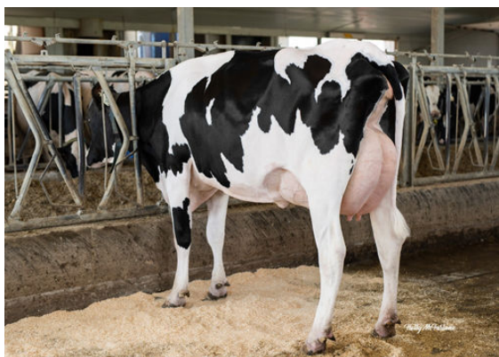
PROGENESIS FABULOUS BRISK